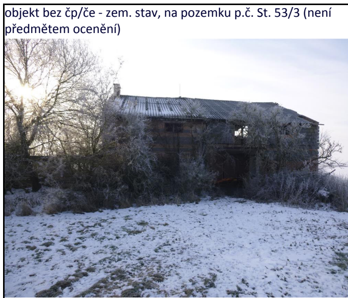
objekt bez čp/če - zem. stav, na pozemku p.č. St. 53/3 (není předmětem ocenění)