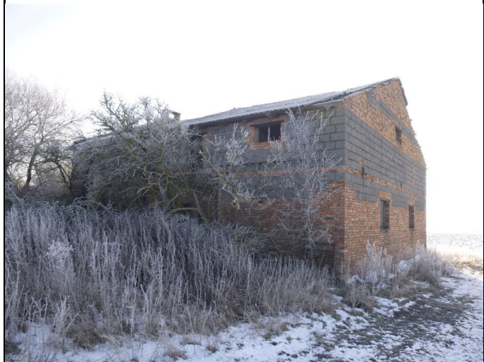
objekt bez čp/če - zem. stav, na pozemku p.č. St. 53/3 (není předmětem ocenění)